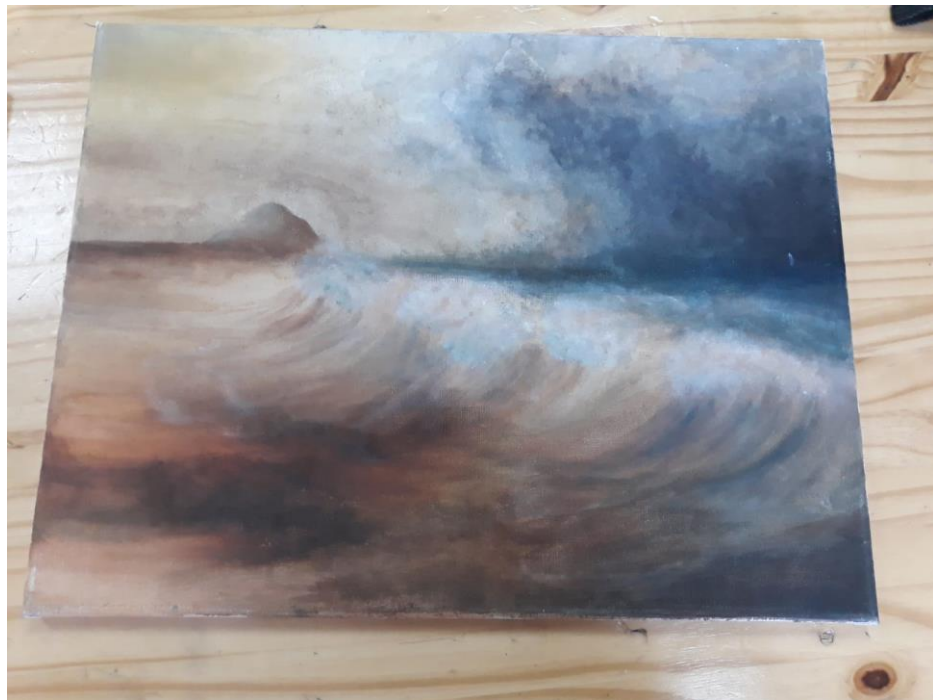
מאיה וסרמן תיכון שיבולים נ"צ