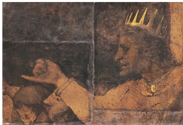
"רחבעם", הנס הולביין הבן, 1530, בזל.

במה שונים הציורים מהנאמר בפסוקים? בשניהם הולביין בחר לצייר דווקא את מה שרחבעם השמיט מעצת הילדים קִטְנֵי עֵבֶה מִמֶּתְנִי אָבִי (מל"א י"ב 10). שימו לב לאצבע הקטנה המושטת כלפי העם.