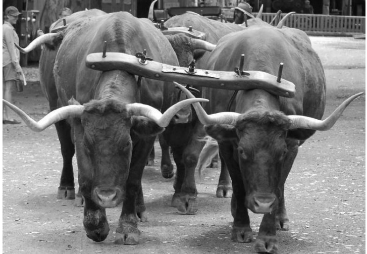
שוורים ועליהם "עול".