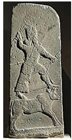
תבליט של האל הַדַּד ניצב על פר, מאה 13 לפנה"ס, סוריה.