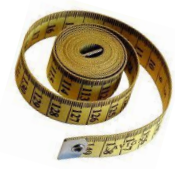
מי נטה עליה קו

איפה היית ביסדי ארץ... מי שם ממדיה כי ידע או מי נטה עליה קו. על מה אדניה הטבעו או מי ירה אבן פנתה (ל"ח)