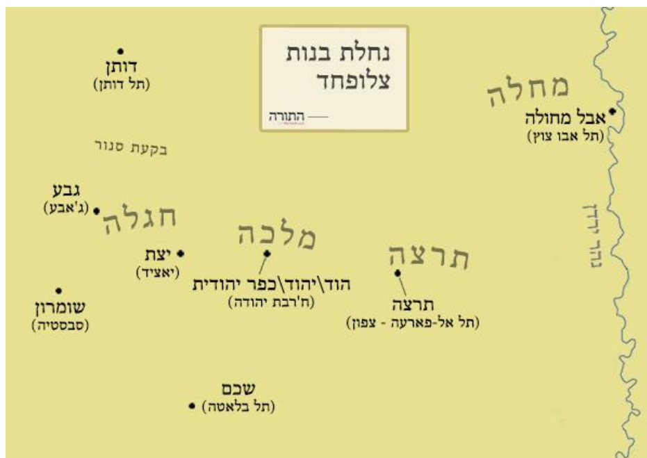
מתוך: "בנות צלפחד: גישה גיאוגרפית-היסטורית" / פרופ' אהרן דמסקי

מלכה , אינה שמה של עיר או כפר ידוע וגם אינה מופיעה בחרסי שומרון, ועל כן ישנה מחלוקת באשר לזיהויה. כשבוחנים את הטופוגרפיה של האזור, אנו רואים שהנחלות של חגלה, מלכה ותרצה ממוקמות בגב ההר ובמורדות המזרחיות של הרי שומרון, במעין מדרגה. יש לשים לב שהנחלות נמצאות באותו סדר שבו מופיעות האחיות בדרך כלל במקרא: חגלה, מלכה ותרצה. לפיכך, בסבירות גבוהה נראה כי נחלת מלכה ממוקמת בין אלה של אחיותיה חגלה ותרצה.