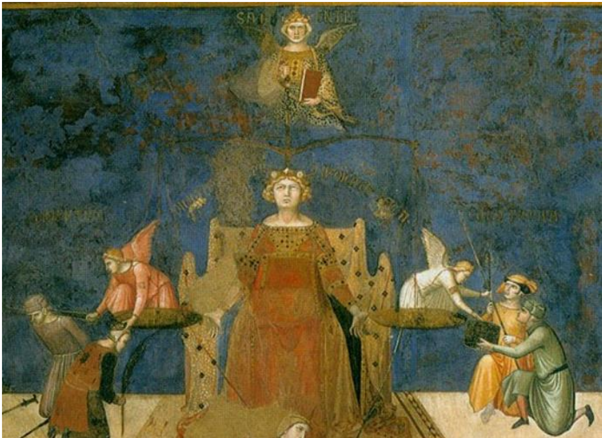
© מתוך ויקישיתוף Collection Palazzo Pubblico (Palazzo Comunale), Siena.